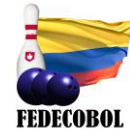
CUADRO No. 1